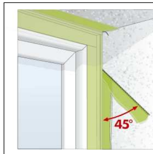
Bild3: Überstehende Folie mit dem Reißfaden unter 45° abreißen.