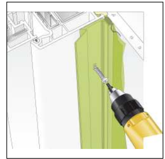
Bild2: Befestigung mit geeigneten Schrauben.